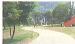
階段を上った時の風景です。