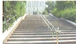
ミッドタウン入口の階段