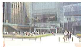
この建物(ミッドタウンタワー)の中から六本木駅に行けます。(案内有)